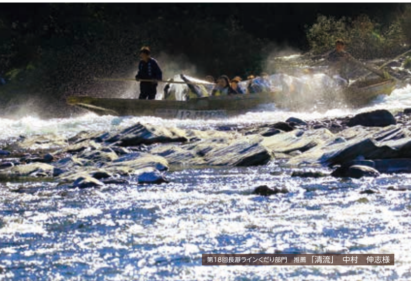
第18回長瀬ラインくだり部門 推薦「清流」中村 伸志様