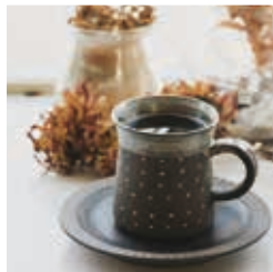
応募作品イメージ

長瀬ラインくだりのある風景の写真や長瀬ラインくだりの魅力が伝わる作品 ※こたつ舟を含む