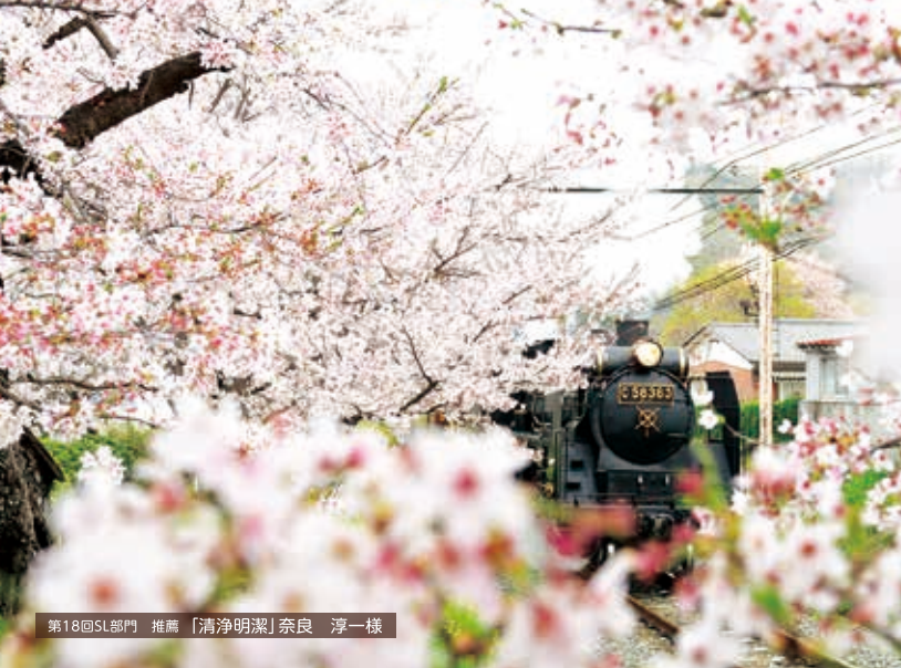
第18回SL部門 推薦「清浄明潔」奈良 淳一様